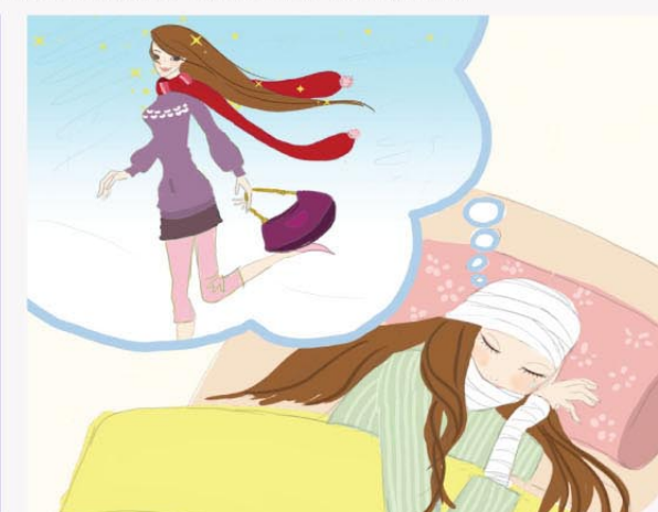
若被保險人同時或先後罹患二種以上之特定傷病時，本公司只給付一次特定傷病保險金。